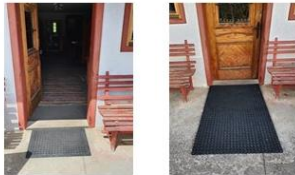
Sommer Fußabstreifer Winter